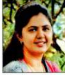
मा.ना.श्रीमती पंकजा गोपीनाथ मुंडे मंत्री, महिला व बाल विकास