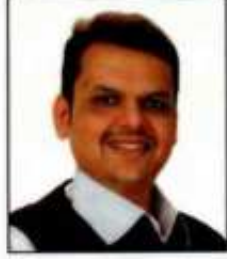
मा.ना.श्री. देवेन्द्र फडणवीस मुख्यमंत्री, महाराष्ट्र राज्य